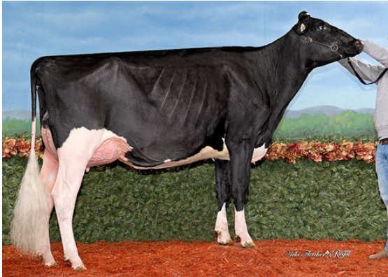
MOSNANG BRIDGESTONE LIVE WIRE DAUGHTER