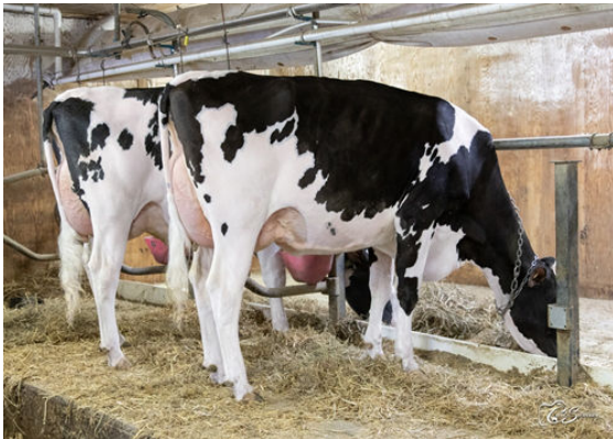
BRIDGESTONE DAUGHTER GROUP L TO R - MICHERET ARDY BRIDGESTONE, MICHERET MYSOFT BRIDGESTONE